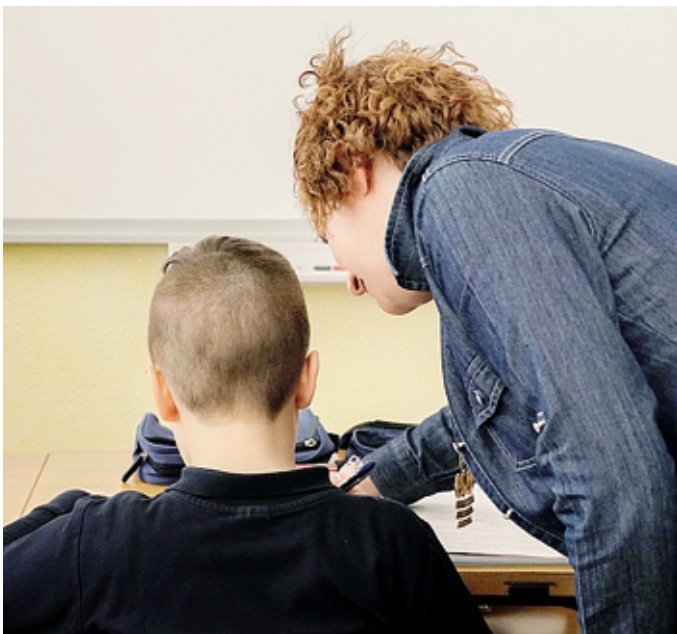
In Bergamasca sono 856 gli studenti con disabilità COLLEONI

Prendendo il solo caso delle scuole dell'Opera Sant'Alessandro, nell'anno scolastico 2024-2025 sono stati 55 gli alunni con disabilità, su un totale di circa 2mila studenti. «Gli alunni certificati che necessitano di un docente di sostegno sono circa il 2,5%. E, rispetto all'anno scolastico 2023-2024, abbiamo aumentato le ore di supporto: da 12mila a 13mila. Perché abbiamo visto e capito che gli studenti avevano bisogno di maggiori attenzioni, è una nostra risposta al progetto educativo che portiamo avanti, che ha tra i suoi fuochi quello dell'inclusione degli