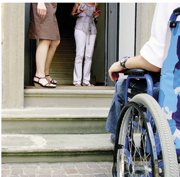
La Regione stanziava in tutto 5,6 milioni per abbattere le barriere

Un aiuto arriva da Regione Lombardia, che ieri ha deliberato - su proposta di Paolo Franco, assessore alla Casa e Housing sociale - uno stanziamento da 5,6 milioni di euro per abbattere le barriere architettoniche negli edifici privati, agevolando quegli interventi che possono rendere più accessibili i condomini e gli appartamenti anche a chi vive un problema (temporaneo o permanente, una disabilità) di deambulazione o sensoriale. Le risorse saranno ripartite tra i Comuni che avevano co-